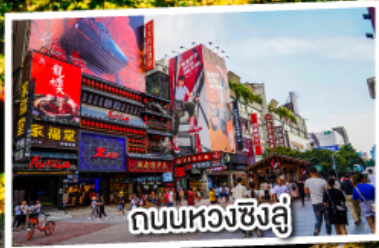
ถนนหลวงซิงลี่