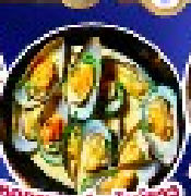
หอยนางรมฝรั่งเศส