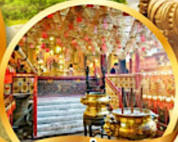
วัดหมื่นโหม่