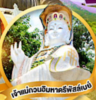
เจ้าแม่กวนอิมหาครีพีส์ลีย์