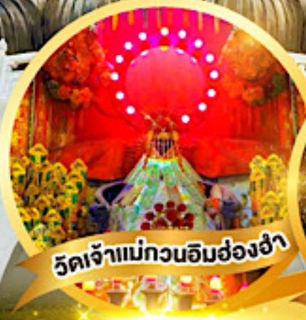
วัดเจ้าแม่กวนอิมฮ่องฮ่า