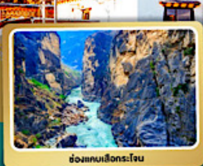
ช่องแคบเล็งกระโจน