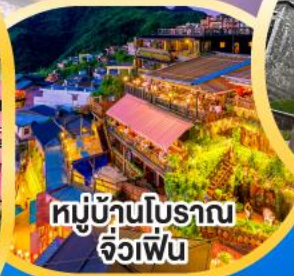
หมู่บ้านโบราณ จิวเฟิ่น