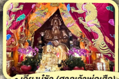
• เอียงบูซิว (ศาลเจ้าพ่อเสือ)