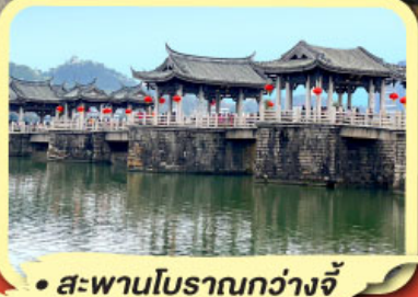
• สะพานโบราณกว่างจี