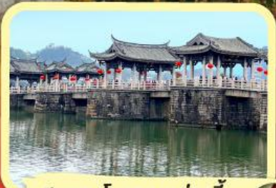
• สะพานโบราณกว้างจี้