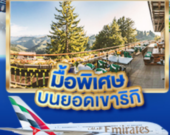
มือพิเศษ บนยอดเขารัตน์