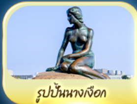
รูปปั้นนางเงือก