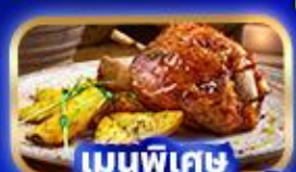
เมนูพิเศษ ขาหมูเยอรมัน

บริการน้ำดื่มวันละ 1ขวด ฟรี! ปลั๊กไฟยูนิเวอร์แซล