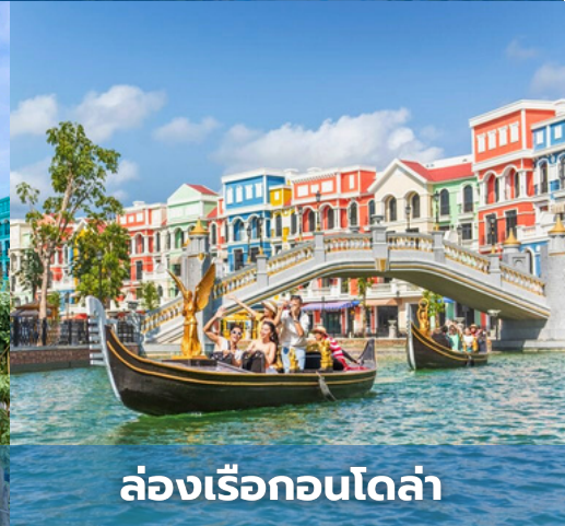
ล่องเรือคอนโดล่า