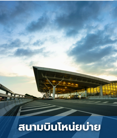
สนามบินโพนเปญ