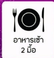
อาหารเช้า 2 มื้อ

แพคเกจยว ครบ ทุกจุดเช็คอิน สุดฮิต ที่พัก 2 คืน ห้องละ 2 ท่าน พักดานัง 1 คืน / พักบานาฮิลล์ 1 คืน ไทด์ออนไลน์ ( ให้ความช่วยเหลือผ่านโทรศัพท์ )