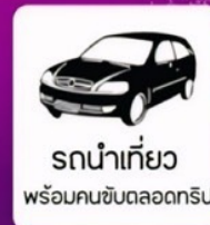
รถนำเที่ยว พร้อมคนขับตลอดทริป