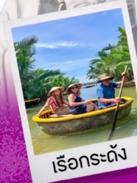
เรือกระด้ง