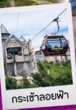
กระเช้าลอยฟ้า

แพคเกจยว ครบ ทุกจุดเช็คอิน สุดฮิต ที่พัก 2 คืน ห้องละ 2 ท่าน พักดานัง 1 คืน / พักบานาฮิลล์ 1 คืน ไทด์ออนไลน์ ( ให้ความช่วยเหลือผ่านโทรศัพท์ )