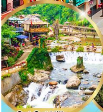
Cat Cat Village