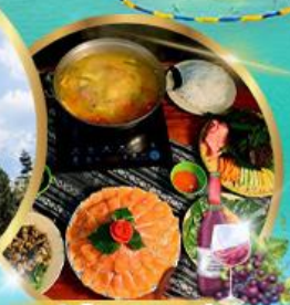
ชาบูหม้อไฟปลาสดเวียดนาม + ไวน์แดง