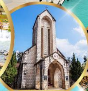
โบสถ์หินซาปา