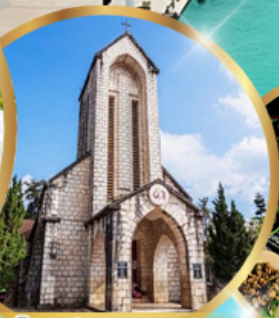
โบสถ์หินซาปา