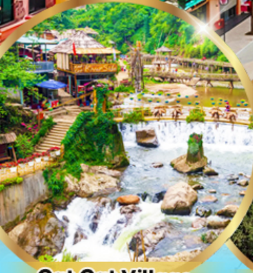
Cat Cat Village