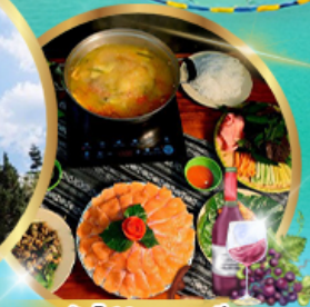
ซาบูหม่อไฟปลาสดเอรียน + ไวน์แดง