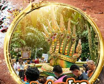
ปากำชะโนด