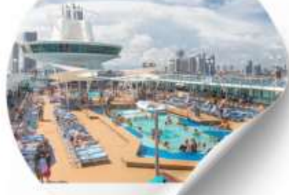
พักผ่อนบนเรือ