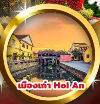
เมืองเก่า Hoi An