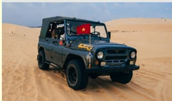
ทะเลทรายขาว