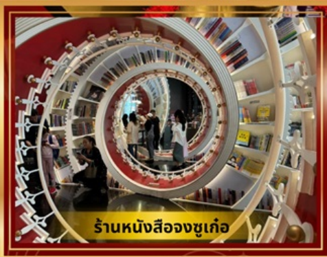
ร้านหนังสือจูกูเก้อ