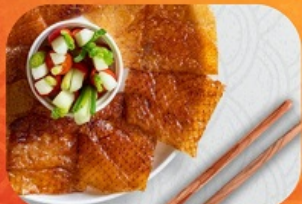
พิเศษ!! เมนูเปิดปักกิ่ง