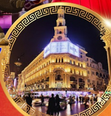
ถนนคนเดินหนานจิง

สัมผัสความยิ่งใหญ่ กำแพงเมืองจีน สิ่งมหัศจรรย์ 1 ใน 7 ของโลก เดอะบันด์ หาดไถ่ทาน ชมหอไข่มุก ชมพระราชวังต้องห้าม เชคอินถนนคนเดินชื่อดัง ห้ามพลาด แวะซื้อ Pop Mart