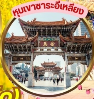
หุบเขาธาระอี้เหลียง