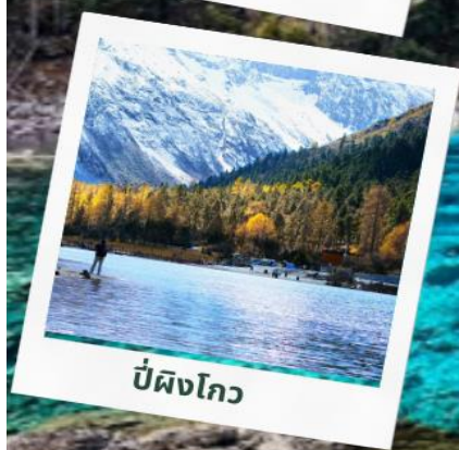
ปี่ผิงโกว