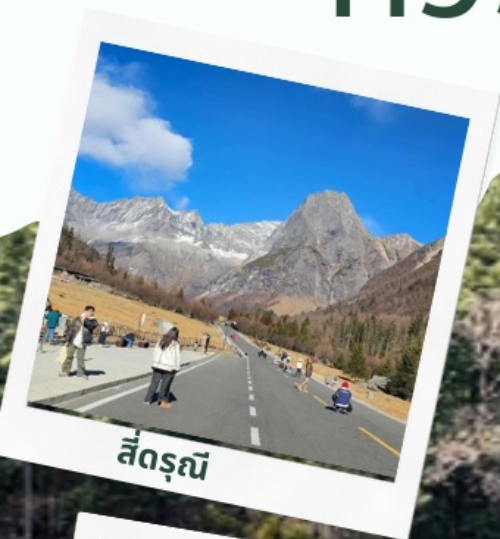
สี่ดรุณี