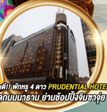
การันตี!! พักหรู 4 ดาว PRUDENTIAL HOTEL ติดถนนนาธาน ย่านช้อปปิ้งจิมซาจуй