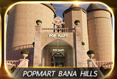
POP MART BANA HILLS

สัมผัสความงามหมู่บ้านฝรั่งเศสที่บานาฮิลล์ ซอปปิง POPMART