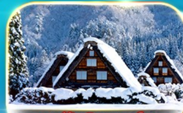
ชมงานประดับไฟนาบานา โนะ ซาโตะ