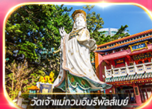
วัดเจ้าแม่กวนอิมรพาสลีย์