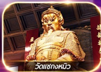
วัดเชกงหวี