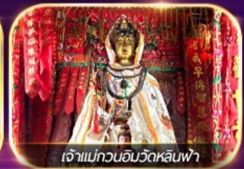
เจ้าแม่กวนอิมวัดหลินฟ้า

เต็มอิ่มทั้งบุญ และ ซ้อมปิ้งแบบจัดเต็ม จิมซาจุ่ย มงก๊ก