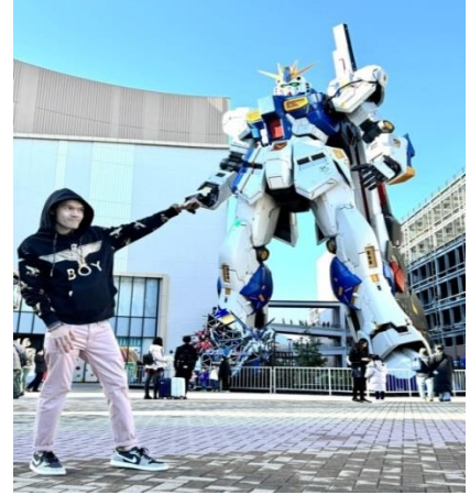
หุ่นกันดั้ม ชื่อ RX93 FF Nu Gundam

เดินทางต่อไปยัง ร้านค้า DUTY FREE ให้ท่านได้ช้อปปิ้งสินค้าปลอดภาษีที่มีคุณภาพ อาทิ เครื่องสำอาง โฟมล้างหน้า(แนะนำ) อาหารเสริม ขนม เครื่องใช้ต่างๆ ฯลฯ ...จากนั้นแวะ แซะรูปกับหุ่นกันดั้มยักษ์ ณ ห้าง LaLaport (หากมีเวลาพอ) มีขนาดใหญ่กว่า Unicorn Gundam ที่โตเกียวและใหญ่กว่า RX93 FF Gundam ที่ Gundam Factory Yokohama เรียกได้ว่าเป็นแลนด์มาร์คสำคัญของเมืองฟูกุโอกะในปัจจุบัน ...จากนั้นอิสระให้ท่านช้อปปิ้งย่าน เทนจิน (Tenjin) หรือ ย่านฮากาตะ (Hakata) เป็นย่านช้อปปิ้งขนาดใหญ่ใจกลางเมือง รวบรวมแหล่งบันเทิง อย่างครบครัน ไม่ว่าจะเป็นตึกต้นไม้ ร้านค้าที่น่าสนใจ และบรรยากาศสุดคลาสสิก หรือจะเป็นย่านของกินอร่อยๆ อย่างย่านยะไต (Yatai) หมายถึง ชุ้มขายอาหารที่มีขนาดเล็กไม่ใหญ่มาก ที่รวมร้านอาหารแบบฉบับท้องถิ่นเอาไว้มากมาย