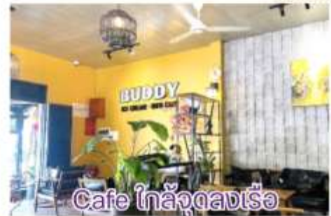
Cafe ไกล่จูดลงเรือ