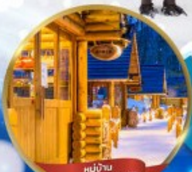
หมู่บ้าน NINGLE TERRACE

สนุกสนาน ณ ลานสกี • หมู่บ้านราเมนอาซาฮิคาว่า • หมู่บ้านนิงเกิลเทอเรส ขบวนพาเหรดเพนกวิน ณ สวนสัตว์อาซาฮิคาว่า • โรงงานช็อกโกแลต โอดารุ • ศาลเจ้าฮอกไกโด • พระใหญ่ HILL OF BUDDHA