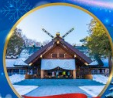
ศาลเจ้าฮอกไกโด