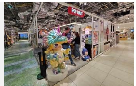
POP MART สายจุ่มถูกใจสิ่งนี้ !