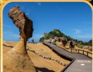
อุทยานหินเหย์หลิว