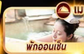
พักออนเซ็น

(***การเข้าเล่นกิจกรรมที่ลานสกีจะขึ้นอยู่กับปริมาณหิมะและสภาพอากาศ***)