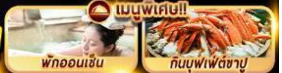
พักออนเซ็น