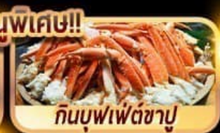
กินบุฟเฟ่ต์ชาบู