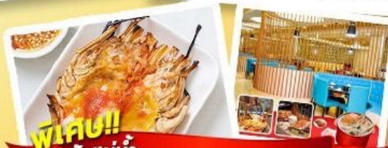
พิเศษ!! ก๊วยแม่น้ำ + HOTPOT SEAFOOD