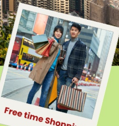
Free time Shopping