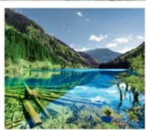
จั๋วจ้ายโกว

จาก 8 ชม. เหลือ 2 ชม. เร็วทันใจด้วยรถไฟความเร็วสูง เติ้งตุ - จั๋วจ้ายโกว