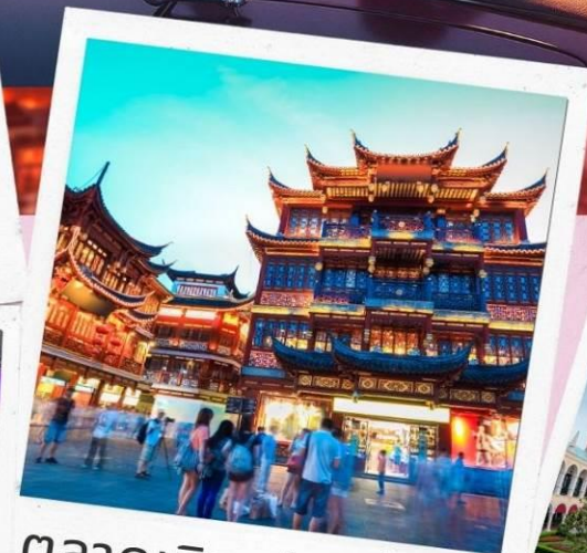
ตลาดเจิ้งหวังเมี่ยว