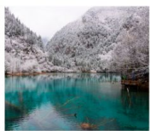
จิว่จ้ายโกว