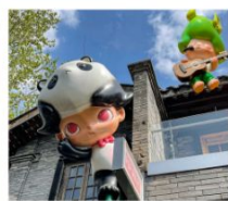
ถนนคนเดินชอยกว้างแคบ