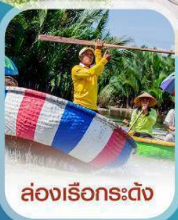
ล่องเรือกระต๊อง