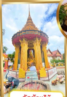
วัดช้างไห้