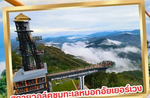
สกายวอล์คชมทะเลหมอกอัยเยอร์เวง

ร่วมโครงการ ลดหย่อนภาษี ลดสูงสุด 15,000.-