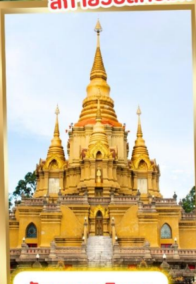
วัดพุทธาริวาส