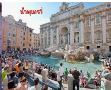
น้ำพุเทร่