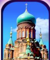
จตุรัสโบสถ์เซนต์โซเฟีย