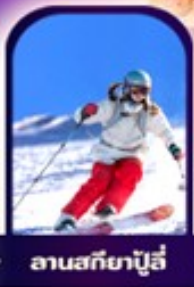
ลานสกียาปู้สี้