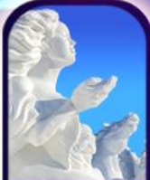
เกาะพระอาทิตย์