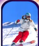
ลานสกียาปู้ลี่