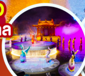
ชมโชว์อุทนีโจว