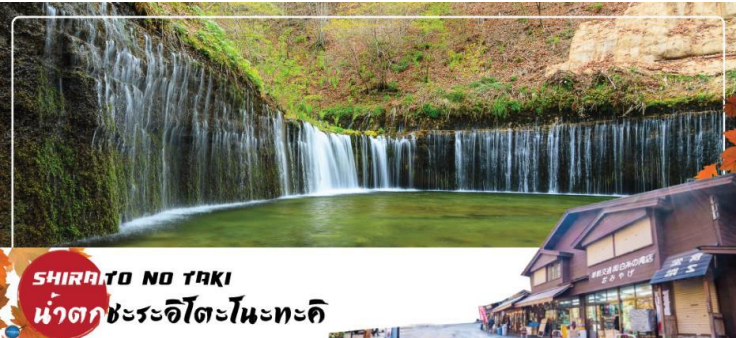
SHIRAITO NO TAKI น้ำตกชิระอิโตะโนะตะคิ

รับประทานอาหารกลางวัน ณ ภัตตาคาร (5) จากนั้นนำท่านสู่ น้ำตกชิราอิโตะ (Shiraito no taki) (ใช้เวลาเดินทางประมาณ 1.15 ชั่วโมง) เป็นน้ำตกตั้งอยู่ที่ เมืองฟูจิโนมียะ จังหวัดชิซุโอกะ เป็นส่วนหนึ่งของอุทยานแห่งชาติฟูจิซากาเนอิซุ ได้รับขึ้นทะเบียนเป็นมรดกโลกพร้อมกับกับภูเขาไฟฟูจิ อุทยานแห่งชาติฟูจิซากาเนอิซุ และทะเลสาบฟูจิทั้งห้าภายใต้ชื่อ "ฟูจิซัง สถานที่ศักดิ์สิทธิ์และแหล่งที่มาของความบันดาลใจทางศิลปะ" เมื่อวันที่ 22 มิถุนายน ค.ศ.2013 น้ำตกชิราอิโตะถือเป็นน้ำตกที่ศักดิ์สิทธิ์ มีศาลเจ้าอาชามะตั้งอยู่ด้วยการไหลของสายน้ำที่แยกสายออกเป็นหลากรอยเส้น ทำให้มองดูแล้วเหมือนกับเส้นด้ายสีขาว จึงเป็นที่มาของชื่อเรียกที่ว่า ชิราอิโตะ ที่แปลตรงตัวว่า ด้ายสีขาว นั่นเอง อีกทั้งที่นี่ยังมีเรื่องราวของการปฏิบัติธรรมในถ้ำที่เคยเกิดภูเขาไฟปะทุขึ้นมาด้วย จึงทำให้ผู้คนให้ความศรัทธากันว่าเป็นที่ชำระล้างจิตใจ และเป็นพื้นที่ศักดิ์สิทธิ์สำคัญของผู้แสวงบุญ จึงถือเป็นพาเวอร์สปอตอีกจุดหนึ่งในญี่ปุ่นที่สามารถชมฟูจิซังได้ในมุมที่ไม่เหมือนใคร เป็นน้ำตกและภูเขาไฟฟูจิตั้งอยู่ด้านหลัง และถือเป็นจุดชมใบไม้เปลี่ยนสีที่สวยงามมากอีกด้วย