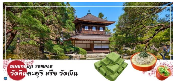
GINKAKUJI TEMPLE วัดกินคะคุจิ หรือ วัดเงิน

จากนั้นนำท่านสู่ วัดกินคะคุจิ (Ginkakuji Temple) หรือ วัดเงิน (ใช้ระยะเวลาในการเดินทางประมาณ 15 นาที) เป็นอีกหนึ่งในสถานที่ที่ขึ้นทะเบียนกับองค์การยูเนสโกให้เป็นมรดกโลกด้านวัฒนธรรม ซึ่งวัดกินคะคุจิเป็นวัดนิกายเซน ถูกสร้างขึ้นโดยโชกุนอชิคากะ โยชิมาสะ หลานชายของท่านโชกุน ที่สร้างวัดกินคะคุจิ (Kinkakuji Temple) หรือ ที่รู้จักกันอย่างกว้างขวางว่าวัดทองสำหรับอาคารของวัดเงิน สร้างขึ้นในรูปแบบเดียวกัน เพียงแต่จะไม่ได้มีสีทอง เป็นอาคาร 2 ชั้น และมีกฟิสิกซ์อยู่บนหลังคา