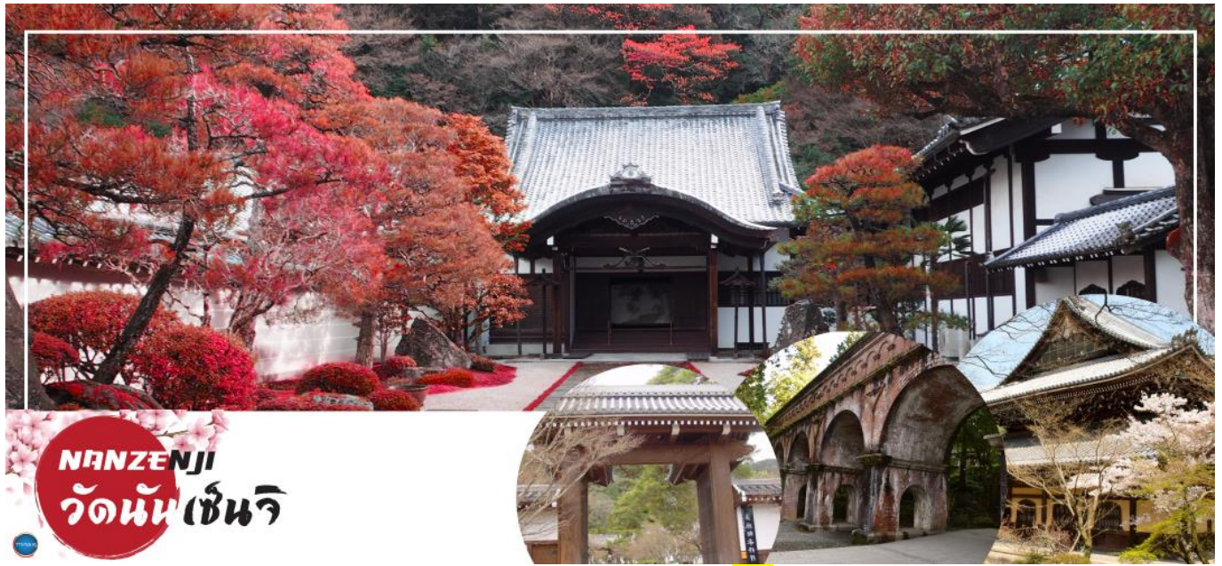
NANZENJI วัดนันเซ็นจิ