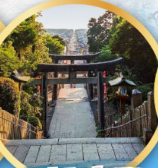
ศาลเจ้ามียาจิดากะ