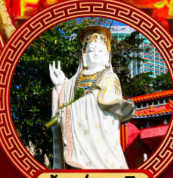
เจ้าแม่กวนอิม รีพัลส์เบย์