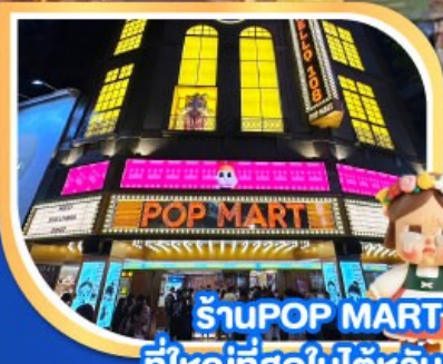
ร้านPOP MART ที่ใหญ่ที่สุดในไต้หวัน