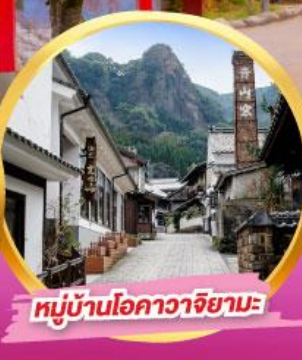
หมู่บ้านโอคาวาจิยามะ