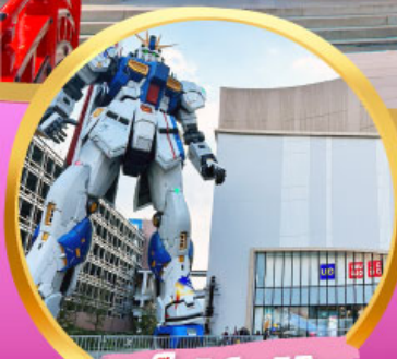
กันดั้ม ปาร์ค ฟุกุโอกะ

สัมผัสความโรแมนติก ชมซากุระในคิวชู พักออนเซ็น 1 คืนพร้อมอาหารเช้า อิสระท่องเที่ยว 1 วันเต็มในฟุกุโอกะ