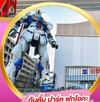
กันดั้ม ปาร์ค ฟุกุโอกะ