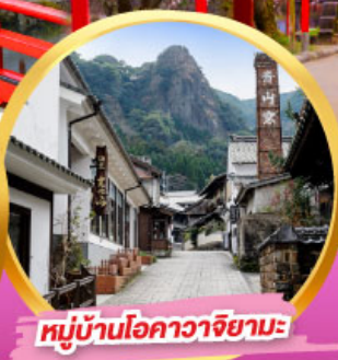
หมู่บ้านโอคาวาจิยามะ