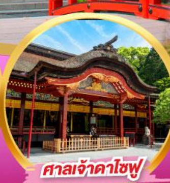
ศาลเจ้าดาไซฟุ