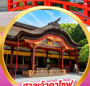
ศาลเจ้าคาโซฟู