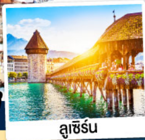
ลูซิิร์น

พิเศษ!! อาบน้ำแร่แช่น้ำอุ่น ณ เมืองลูคอร์เนค เมืองแห่งน้ำแร่สวิตเซอร์แลนด์