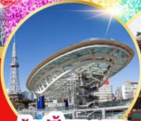
ช้อปปิ้งซากาเอะ วัดอาซากุซะ